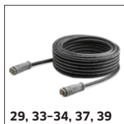
29, 33-34, 37, 39