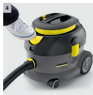
4 Ovládání nohou