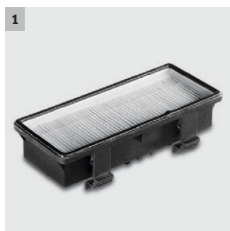
1 Filtr HEPA pro čistý odpadní vzduch

Tichý, obratný vysavač s nožním spínačem a ochrannou proti nárazu. Vysavač je vybaven dvěma pogumovanými bočními koly a dvěma vodicími kolečky pro lepší pojíždění. Výklopný hák na síťový kabel a navinutí síťového kabelu na hlavě turbíny usnadňují jeho uložení. Parkovací pozice pro podlahovou hubici a zásuvka na napojení sacího elektrokartáče dotváří stroj.