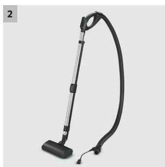
2 Přípojka pro elektrické sací kartáče