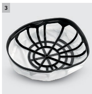
3 Hlavní filtrační koš